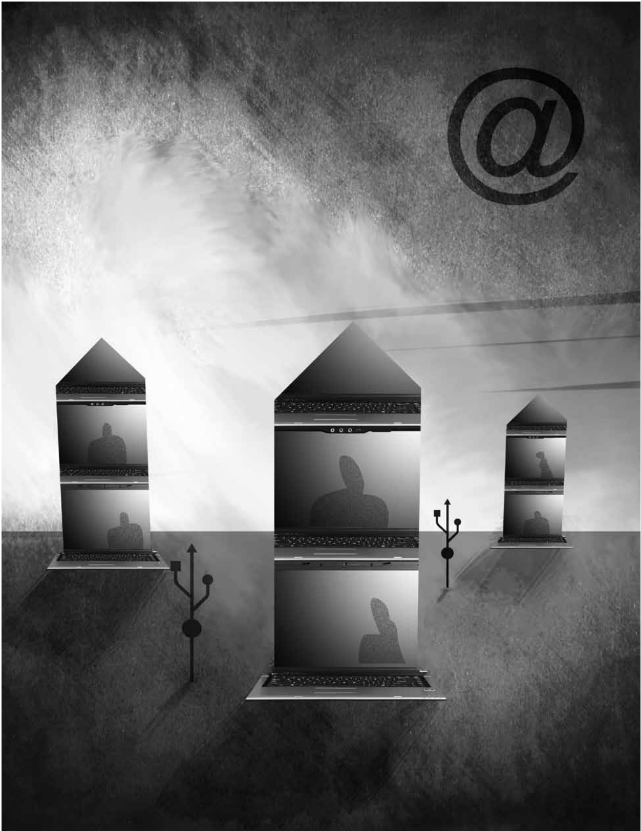
ILUSTRACIÓN | DANIEL FAJARDO B.