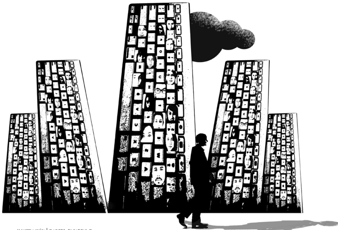
ILUSTRACIÓN | DANIEL FAJARDO B.

el Bank of Scotland —3,49 billones de dólares (Forbes, 2009)—, que son mayores al PIB de cualquier país del mundo, salvo Japón y Estados Unidos (Banco Mundial 2009: 356-357) 4 .